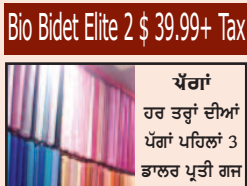
Bio Bidet Elite 2 $ 39.99+ Tax