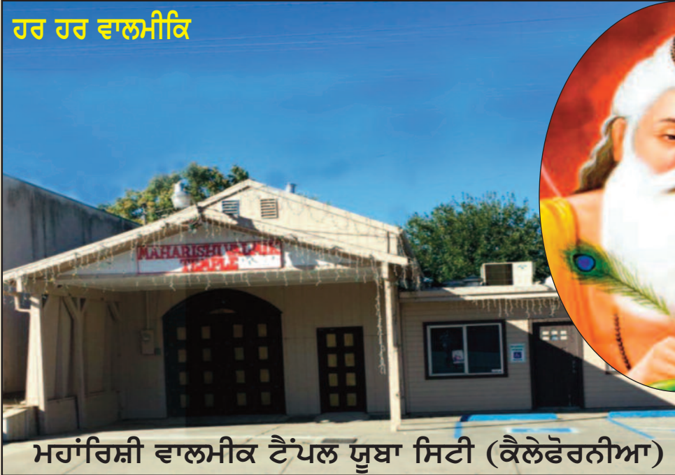
ਮਹਾਂਰਿਸ਼ੀ ਵਾਲਮੀਕਿ ਟੈਂਪਲ ਯੂਬਾ ਸਿਟੀ (ਕੈਲੇਫੋਰਨੀਆ)