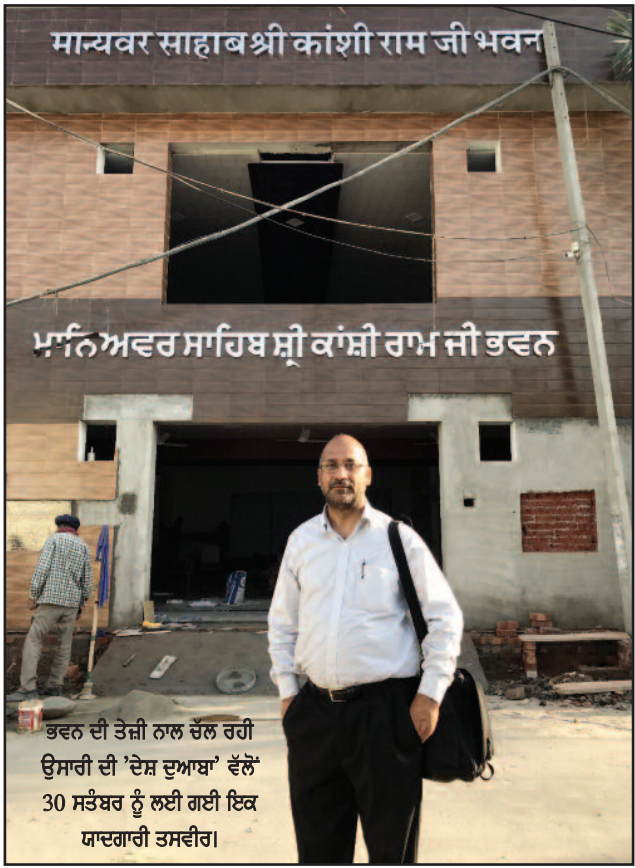
ਭਵਨ ਦੀ ਤੇਜ਼ੀ ਨਾਲ ਚੱਲ ਰਹੀ ਉਸਾਰੀ ਦੀ 'ਦੇਸ਼ ਦੁਆਬਾ' ਵੱਲੋਂ 30 ਸਤੰਬਰ ਨੂੰ ਲਈ ਗਈ ਇਕ ਯਾਦਗਾਰੀ ਤਸਵੀਰ।

ਬਸਪਾ ਇਕ ਰਾਜਨੀਤਿਕ ਪਾਰਟੀ ਹੈ। ਇਸ ਦੀ ਲੀਡਰਸ਼ਿਪ ਅਤੇ ਵਰਕਰਾਂ ਨੂੰ ਆਪਣੇ ਅਤੀਤ ਦੇ ਇਤਿਹਾਸ ਤੋਂ ਜ਼ਰੂਰ ਜਾਣੂੰ ਹੋਣਾ ਅਤੇ ਅਗਾਂਹਵਧੂ ਪਹਿਲੂਆਂ ਤੇ ਅਮਲ ਕਰਨਾ ਹੋਵੇਗਾ। ਇਹੀ ਆਪਣੇ ਰਹਿਨੁਮਾ ਨੂੰ ਸੱਚੀ ਸ਼ਰਧਾਂਜਲੀ ਕਹੀ ਜਾ ਸਕਦੀ ਹੈ ਅਤੇ ਉਹਨਾਂ ਦੇ ਪ੍ਰੀਨਿਰਵਾਣ ਦਿਵਸ 'ਤੇ ਬਸਪਾ ਵੱਲੋਂ ਉਹਨਾਂ ਦੇ ਨਾਂ 'ਤੇ -ਤਰਸੇਮ ਜਲੰਪਰੀ (ਸੰਪਾਦਕ)