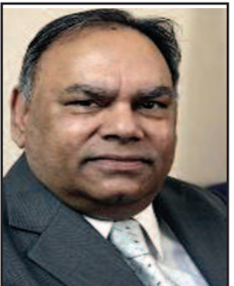
Ramesh Chander Ambassador Rtd. IFS

involve themselves in this huge task to change the societal 'mind set' that safai is required to be done by so-called Bhangis and Valmikis alone. - Take remedial measures to end and stop almost 100 percent reservation in posts of Safai Karamcharis. The votaries of 'No Reservation on the basis of caste', the so-called General Samaj or Upper Castes, shall get their due and rightful share in these posts. Otherwise they should stop crying from the house-tops against the caste based reservations. - We have made many successful strides in technology and science. Why aren't our technicians and scientists encouraged to develop cost effective mechanical or electronic equipment to clean the gutters and sewerages? Why don't our local bodies tend to use the already existing technology to carry out the dirty work, thus relieving the safai karamcharis from such degrading and inhuman jobs? Provide safety gears and sensors for toxic fumes to safai karamcharis to make their job somewhat less hazardous. Invest and make appropriate budgetary allocations to address these issues. Mere lip service will not do. With this I pay my tributes to Mahatma Gandhi on his birth anniversary and wish Swachh Bharat Abhiyan further success.