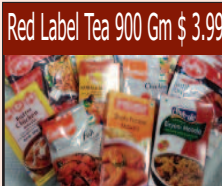
Red Label Tea 900 Gm $ 3.99

ਹਰ ਕਿਸਮ ਦੀ ਦਾਲ ਸੇਲ 'ਤੇ ਹੈ। ਇੱਥੇ ਤਾਜ਼ਾ ਸਬਜ਼ੀਆਂ ਹਰ ਰੋਜ਼ ਮਿਲਦੀਆਂ ਹਨ।