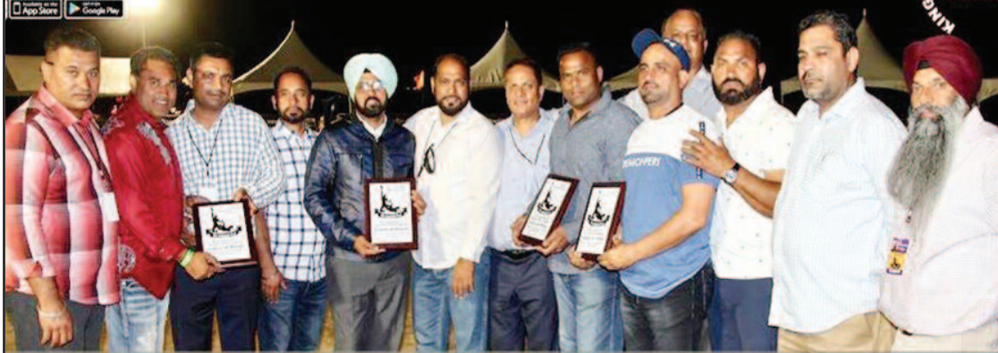
ਕਿੰਗਜ਼ ਸਪੋਰਟਸ ਕਲਚਰ ਕਲੱਬ ਸੈਕਰਮੈਂਟੋ ਵਲੋਂ ਕਬੱਡੀ 6ਵਾਂ ਵਰਲਡ ਕਬੱਡੀ ਕੱਪ ਯਾਦਗਾਰੀ ਹੋ ਨਿਬੜਿਆ। (ਰਿਪੋਰਟ ਅਤੇ ਤਸਵੀਰਾਂ ਦੇਖੋ ਸਫਾ 11, 12, 13 'ਤੇ)