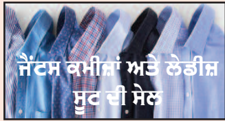
ਜੈਂਟਲ ਕਮੀਜ਼ਾਂ ਅਤੇ ਲੇਡੀਜ਼ ਸੂਟ ਦੀ ਸੇਲ

Toilet Water Pressure (Elite 2 Bio Bidet) A budget Friendly solution for your desire to feel exceptionally clean and reduce toilet paper waste Only $ 41.99 + Tax