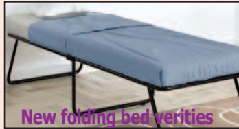
New folding bed varieties

Loose Fabrics, Groceries, Blankets, Vegetables