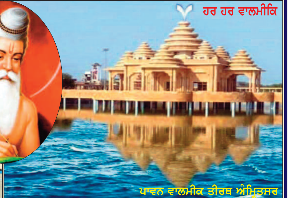
ਪਾਵਨ ਵਾਲਮੀਕਿ ਤੀਰਥ ਅੰਮ੍ਰਿਤਸਰ