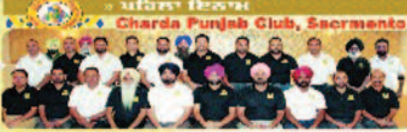
Gharda Punjab Club, Sacramento